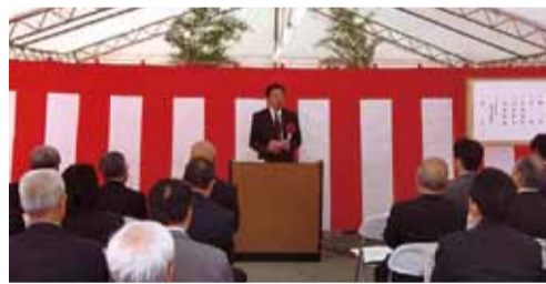
高遠発電所起工式

県企業局が新たに建設する、奥裾花第2発電所(10月30日)と高遠発電所(11月11日)の起工式に、県議会の代表として出席しました。新しいエネルギーの地産地消の拠点としての運用が期待されます。