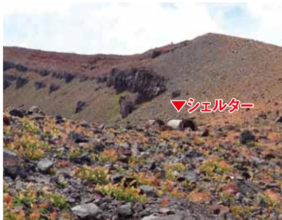
浅間山(前掛山)に設置されているシェルター

○福祉のまちづくりの推進 334万円 福祉のまちづくり周知用パンフレットの作成やパーキング・パーミット