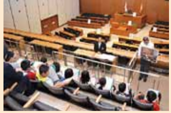
上村小・和田小の皆さん

議場説明は約8千人に 県民に身近な議会づくりの一環として、県庁見学に訪れた小学生の議場見学時に、正副議長や広報委員などが説明をする取組を実施しました。今年度は全体で133校、7、8、14人に実施し、このうち私は、58校(79回)3、121人の皆さんに説明できました。