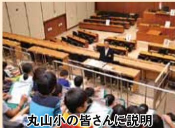
丸山小の皆さんに説明

小学生(主として4年生)の皆さんが県庁見学で議場を訪れてくれた際には、できるだけ正副議長や広報委員が説明に当たるようにしています。10月末までに104校6千人余の皆さんに対応し、このうち私は41校(56回)2,161人の皆さんに説明しました。特に母校の丸山小学校の皆さんからは後日心のごもったお礼と感想のお手紙をいただき感無量でした。