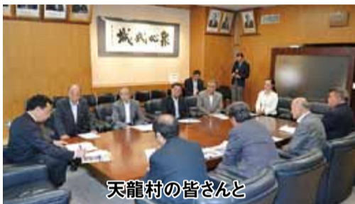
天龍村の皆さんと

地域や団体からの要望や陳情をお受けするのも正副議長の仕事の一つです。地元の課題と引き比べてみたり、県内の様々な課題について知ることでもできたり、大変勉強にもなっています。