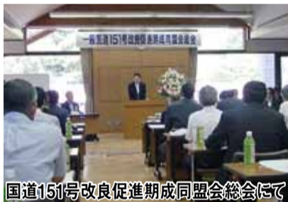
国道151号改良促進期成同盟会総会にて

県議会の代表としてお招きいただいた会合やイベント等に議長と手分けして出席し、お祝いや激励の言葉を述べています。特に、リニアや三遠南信の総会など、南信地域に関わりの深いものは極力出席するようにしています。