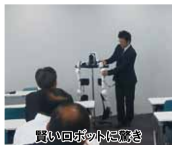
買いロボットに驚き