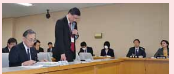
病院機構から参考人聴取