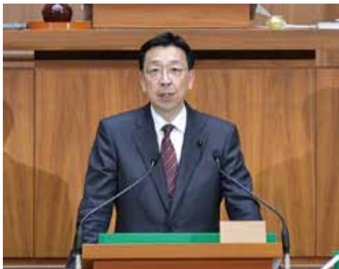
今期最後の一般質問(通算27回目)

2期目の任期も早いもので残りわずかとなりました。引き続き政務活動に誠心誠意取り組んでまいります。お気軽に、ご意見やご要望をお寄せください。