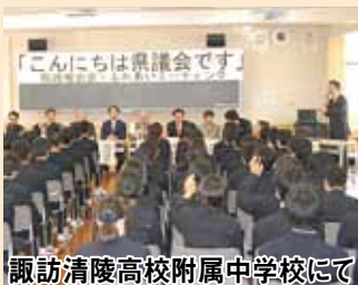
諏訪清陵高校附属中学校にて

10月20日、諏訪清陵高校附属中学校で今年度1回目の「こんにちは県議会です」を開催しました。正副議長、広報委員、地元県議の9名が出席し、2年生75名の皆さんをはじめ約110人の御参加がありました。最初に広報委員から県議会の役割と仕組みや県議会の取組状況について紹介し、続いて生徒の皆さんから、県議会の役割や活動などについて熱心に多くの質問が寄せられました。鋭い再質問や地域活性化への要望に感心させられました。