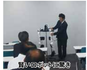
買い物ロボットに驚き