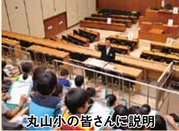
丸山小の皆さんに説明

小学生(主として4年生)の皆さんが県庁見学で議場を訪れてくれた際には、できるだけ正副議長や広報委員が説明に当たるようにしています。10月末までに104校6千人余の皆さんに対応し、このうち私は41校(56回)2,161人の皆さんに説明しました。特に母校の丸山小学校の皆さんからは後日心のおもったお礼と感想のお手紙をいただき感無量でした。