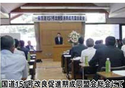
国道151号改良促進期成同盟会総会にて

8月24日、関東甲信越1都9県議長会に出席しました。長野県議長会からは、「中央新幹線の整備に関連した地域の取組への支援を求めることについて」を私が提案し、全会一致可決されました。採択された議案は、後日国会並びに政府関係機関等へ提出されます。