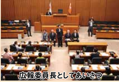
広報委員長としてあいさつ

県民の皆様身近で開かれた県議会を目指すことを目的として、県庁見学イベントに訪れた小学生らの皆さんに議場を開放し、正副議長の見学による本会議での質疑応答を模擬体験しながら、議会の役割や活動を学んでいただきました。私も知事や議長役を務めました。アンケートによれば、「よい経験になった」との多くの感想をいただきました。