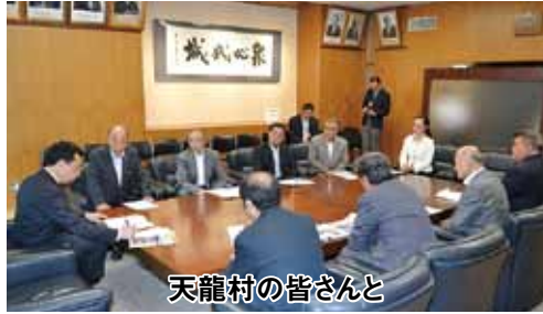
天龍村の皆さんと

県議会の代表としてお招きいただいた会合やイベント等に議長と手分けして出席し、お祝いや激励の言葉を述べています。特に、リニアや三遠南信の総会など、南信地域に関わりの深いものは極力出席するようにしています。