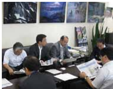
環境省で実情を訴える