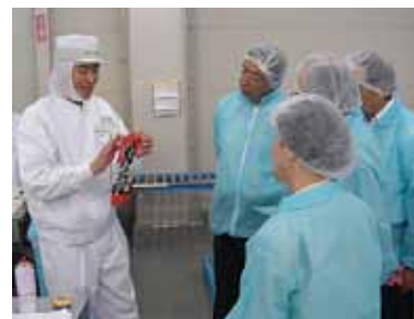
大和グラビヤさんにて