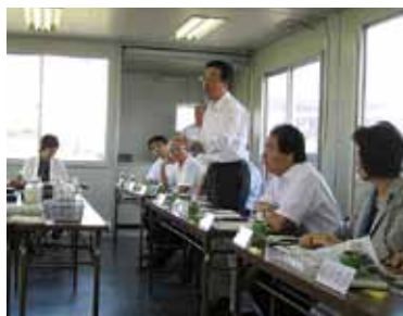
リサイクルについて熱心に質疑

また、前号で報告した山岳トイレの改善に国の支援の継続を求める意見書に沿って、正副委員長で環境省を訪れ、実情を訴えました。